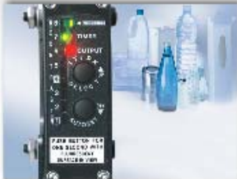
RETROSMART® Rilevazione impeccabile di qualsiasi cosa...da bottiglie trasparenti PIENE a lattine lucide.