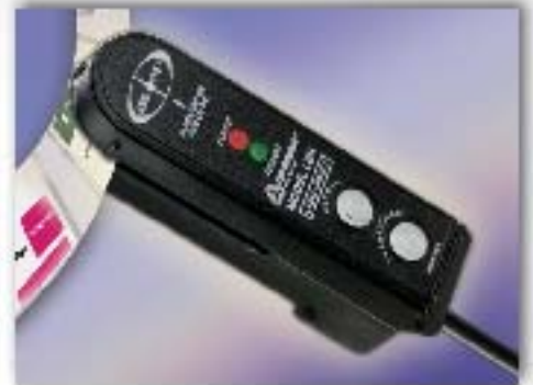
LABEL-EYE® Ottimizzato per la rilevazione di etichette, One-Touch AUTOSET™. Solo $99 USD.