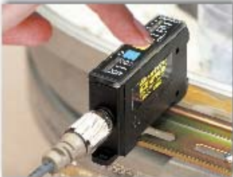
SMART EYE® EZ-PRO One-Touch AUTOSET™ locale o remoto con la funzione opzionale Automatic Contrast Tracking.